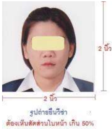
ตัวอย่างรูปถ่ายเพื่อยื่นขอวีซ่า U.S.A.

หลังเข้ารับการสัมภาษณ์โดยประมาณ 7 วันทำการ หนังสือเดินทางของท่าน จะถูกส่งคืนมาที่บ้านท่านทางไปรษณีย์ ตามที่อยู่ที่คุณกรอกในแบบฟอร์มไว้