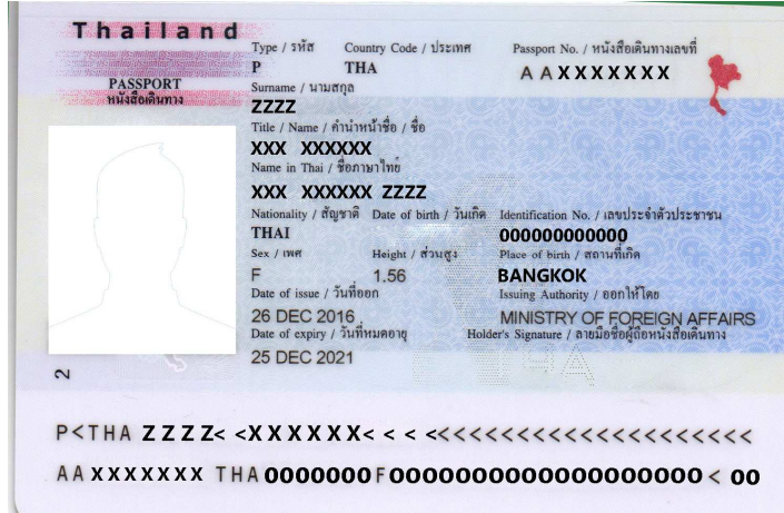
(ตัวอย่างหน้าพาสปอร์ต และรูปถ่าย)

2. พาสปอร์ตเล่มจริง ต้องมีหน้าว่าง สำหรับประทับตราวีซ่าและตราเข้า-ออก อย่างน้อย 2 หน้าเต็ม ลูกค้าถือไปทึ่สนามบินเอง ณ วันเดินทาง (หนังสือเดินทางต้องเป็นเล่มที่ส่งชื่อให้เราทำวีซ่าเท่านั้น!!)