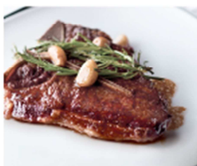
CHOPS GRILLE SM