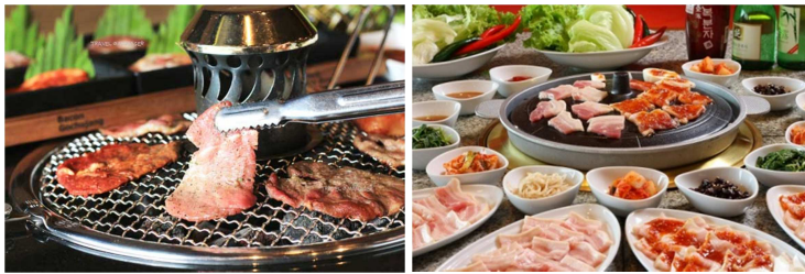
ค่ำ รับประทานอาหารค่ำ ณ ภัตตาคาร(มีที่ 8) เมนู BBQ บุฟเฟต์ หมู เนื้อ ไก่ ซีฟู้ด เดิมไม่อัน

นำท่านชม พระราชวังเคียงบ็อด ซึ่งเป็นพระราชวังไมโบราณที่เก่าแก่ที่สุด สร้างขึ้นใน ค.ศ. 1394 หรือในอดีตกว่า 600 ปีก่อน ภายในพระราชวังแห่งนี้มีหมู่พระที่นั่งมากกว่า 200 หลัง แต่ได้ถูกทำลายไปมากในสมัยที่ญี่ปุ่นเข้ามาบุกยึดครอง ทั้งยังเคยเป็นศูนย์บัญชาการทางการทหารและเป็นที่พักพิงของกษัตริย์ ปัจจุบันได้มีการก่อสร้างหมู่พระที่นั่งที่เคยถูกทำลายขึ้นมาใหม่ในตำแหน่งเดิม ถ่ายภาพคู่กับพลับพลากลางน้ำเคียงเฮวรู ที่ซึ่งเคยเป็นท้องพระโรงออกงานสโมสรสันนิบาตต่างๆ สำหรับต้อนรับแขกบ้านแขกเมือง จากนั้นนำท่าน ช้อปปิ้งสินค้าปลอดภาษีที่ ดิวตี้ฟรี ที่มีสินค้าชั้นนำให้ท่านเลือกซื้อมากมายกว่า 500 ชนิด อาทิ นำหอม เสื้อผ้า เครื่องสำอาง กระเป๋า นาฬิกา เครื่องประดับ ฯลฯ หากพอมีเวลาพาท่านเดินชม คลองของเกซอน ซึ่งเดิมเป็นคลองเก่าแก่ในอดีตมีอายุกว่า 600 ปี ที่ทอดผ่านใจกลางเมืองหลวง แต่ในปัจจุบันได้มีการพัฒนา และบูรณะคลองแห่งนี้ขึ้นมาใหม่ ทำให้กรุงโซลมีคลองที่ยาวกว่า 6 กิโลเมตร ที่มีแต่น้ำใส จนสามารถมองเห็นตัวปลาหลากพันธ์ที่กำลังแหวกว่ายไปมา ปัจจุบันโครงการของเกซอนได้กลายเป็นสถานที่จัดกิจกรรมต่างๆ อาทิ งานแสดงศิลปะต่างๆ งานดนตรี นิทรรศการดอกไม้ ฯลฯ และยังมีสวนสาธารณะทั้งสองฝั่งคลอง