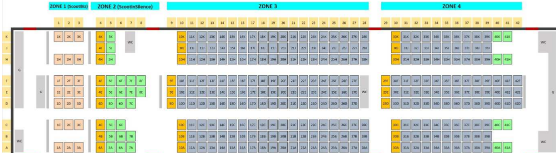
787-8 Seat Product Information

** ค่าทัวร์ไม่รวมค่าอาหารบนเครื่อง สามารถสั่งซื้อจากเล่มเมนูบนเครื่องได้เลยเนื่องจากตัวกรุ๊ปไม่สามารถสั่งจองล่วงหน้าได้