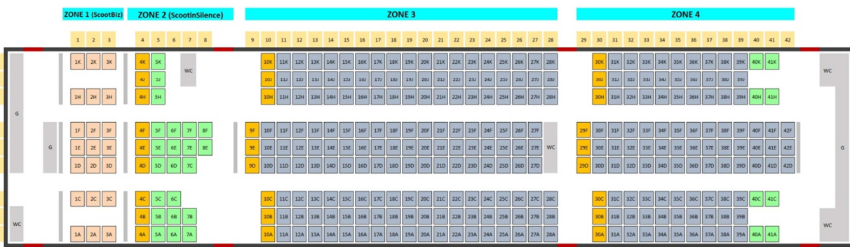
787-8 Seat Product Information

** ค่าตั๋วไม่รวมค่าอาหารบนเครื่อง สามารถสั่งซื้อจากเล่มเมนูบนเครื่องได้เลยเนื่องจากตัวกรุ๊ปไม่สามารถสั่งจองล่วงหน้าได้