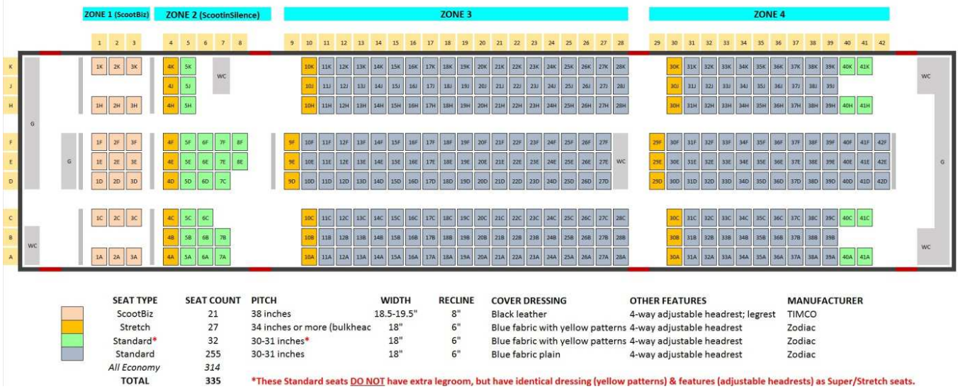
787-8 Seat Product Information

2. ค่าที่พักห้องละ 2 ท่านตามโรงแรมที่ระบุไว้ในรายการหรือระดับเทียบเท่า กรณีเดินทาง3 ท่านจะเป็นห้องTriple จะเป็นแบบเตียงเดี่ยวสามเตียงหรือแบบเตียงใหญ่1เตียงเตียงเดี่ยว1เตียง เป็นการจัดแบบเตียงของทางโรงแรมไม่สามารถระบุได้ กรณีโรงแรมมีห้อง Triple ไม่เพียงพอ ขอสงวนสิทธิ์ในการจัดห้องให้เป็นแบบ แยก 2ห้อง คือ 1ห้องพักคู่ และ 1ห้องพักเดี่ยว โดยไม่ค่าใช้จ่ายเพิ่ม