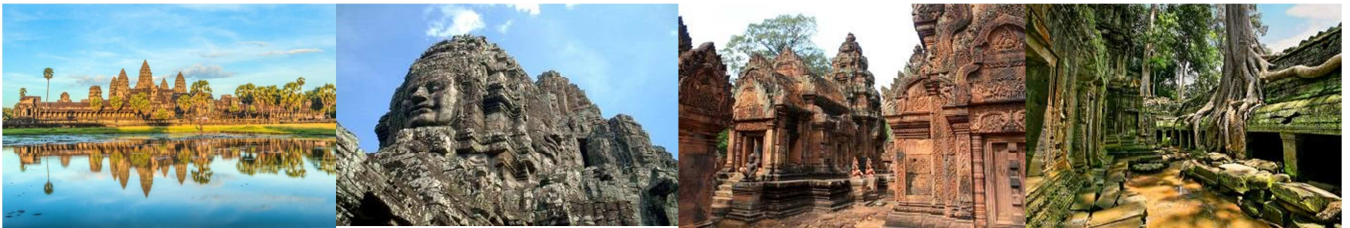
พักที่ TARA ANGKOR HOTEL ระดับ 4 ดาวหรือเทียบเท่า

หลังรับประทานอาหาร นำท่านเดินทางสู่ Night Market ตลาดกลางคืน ให้ท่านได้มีเวลาอิสระเลือกซื้อสินค้าและชมเมืองเสียมเรียบยามค่ำคืนและอิสระเดินเล่นที่ Pub Street ถนนคนเดินรูปแบบถนนข้าวสารบ้านเราเป็นแหล่งกินดื่มที่นิยมของนักท่องเที่ยวต่างชาติ