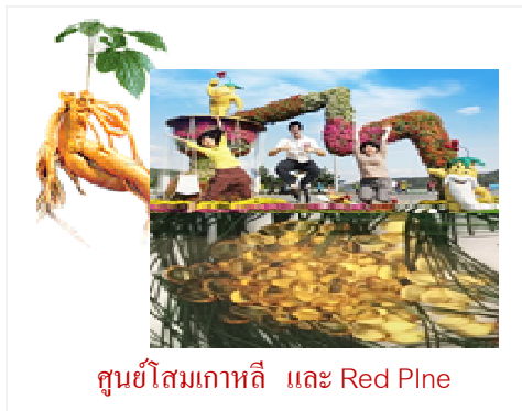
ศูนย์โสมเกาหลี และ Red Pine