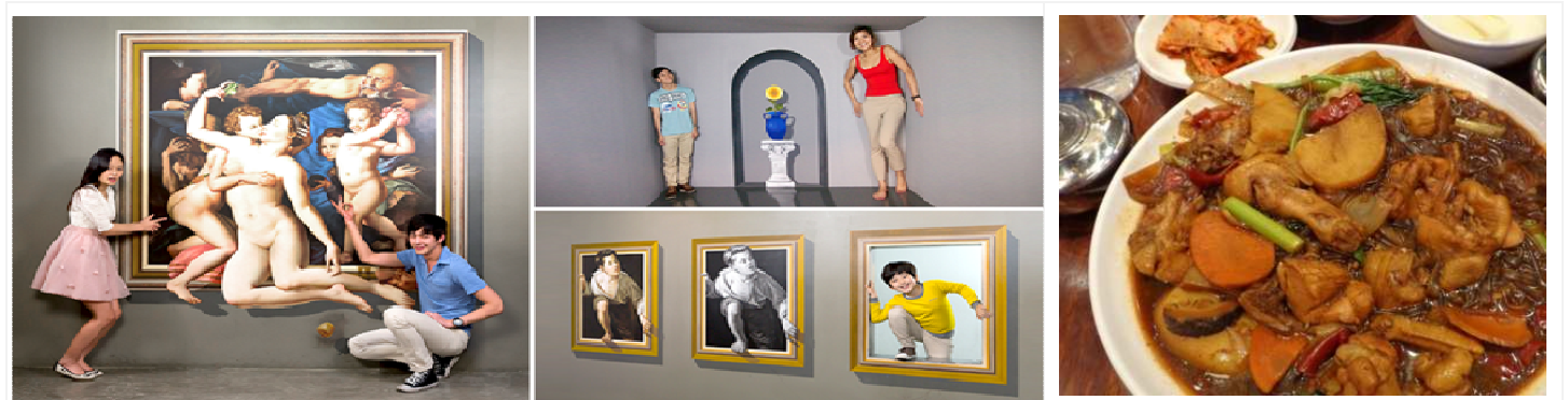
TRICK ART MUSEUM

ภูเขานมซาน หอคอย N Tower สายเคเบิล Love Rock Cable พาท่านขึ้นภูเขานัมซาน Namsan – ภูเขาเพียงลูกเดียวใจกลางเมืองหลวงและอิสระถ้ำรูปคู่หอคอย N Tower เป็น 1 ใน 17 หอคอยเมืองที่สูงที่สุดในโลก สูงถึง 480 เมตรเหนือระดับน้ำทะเล ณ เขานัมซานใจกลางเมืองหลวง สถานที่ละครหนังเกาหลีหรือหนังไทยสไตล์เกาหลีมาถ่ายทำกัน (ความ เชื้อ: เตรียมแม่กุกกุญแจลูกกุญแจเพื่อ ไปถือคกุญแจคู่รัก ณ Love Rock Cable ซึ่งเชื่อกันว่า ถ้าใครขึ้นมาคล้องกุญแจและโยนลูกกุญแจ ทิ้งไป คู่รัก คู่ครอบครัว คู่เพื่อน คู่พี่น้อง คู่มิตรนั้นจะมีความรักที่ยั่งยืนหรือไม่มีใครมาพรากจากกันได้) (ค่าบริการที่ขึ้นสู่จุดชมวิว บนหอคอย ไม่รวมไว้ในค่าทัวร์)