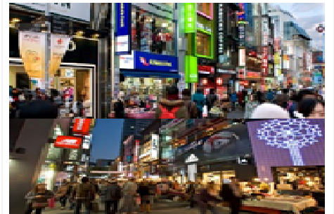
เมียงดอง