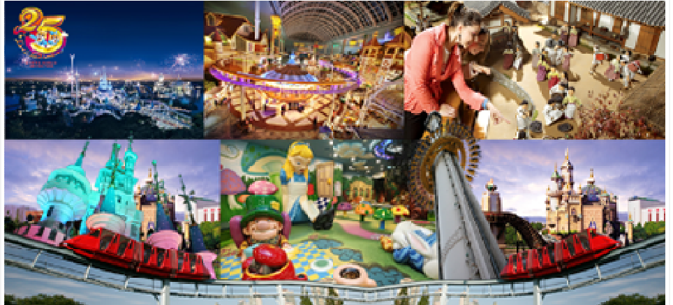
เติมเต็มความสุขของท่านด้วยบัตร Magic Pass Ticket ที่สวนสนุกสุดเจ๋งเว็ลด์ และ พิพิธภัณฑ์พื้นบ้านเกาหลี Lotte World Folk Museum