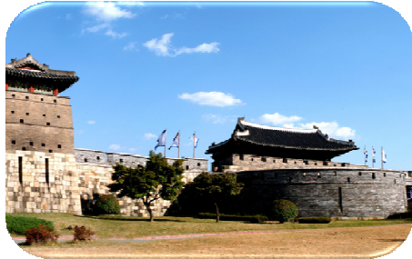
ป้อมมรดกโลกฮวาของ