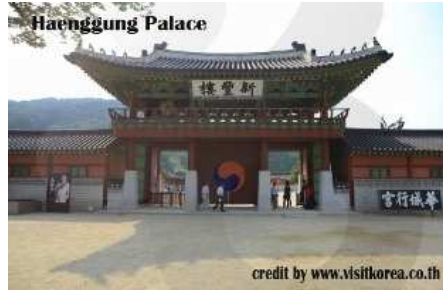
วังฮวาของ แสงุง " วังรอง "