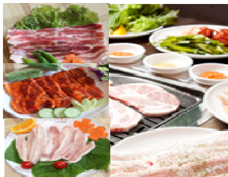
เมนูบาร์บีคิวย่างคาลบิสสไตล์เกาหลี