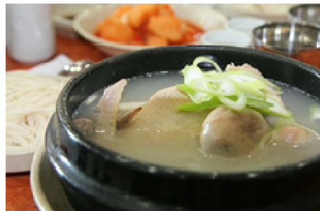
เมนูไก่ตุ๋นโสม