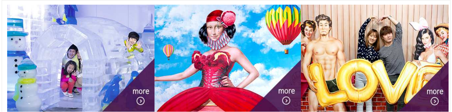
ICE MUSEUM | CARNIVAL STREE | LOVE MUSEUM

หลังจบรายการท่องเที่ยว ค่าคืนนี้...ขอส่งทุกท่านพักในเมืองหลวงกรุงโซล ที่มีประชากรถึง 1 ใน 4 ของประเทศ มีตึก 63 ชั้น ตึกที่ สูงที่สุด มีแม่น้ำฮันไหลผ่านใจกลางเมืองหลวงของกรุงโซล