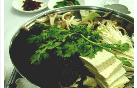
เมนูซาบูหม้อไฟ