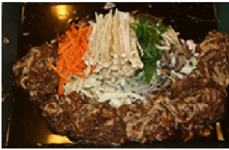
เมนูบาร์บีคิวไฟหรือบลูโกกิ