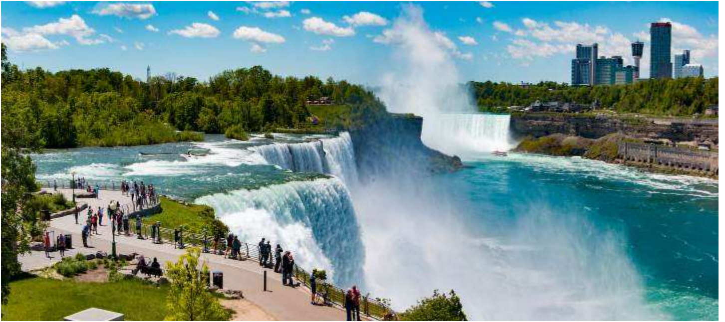
วันที่หก เมืองบัฟฟาโล่ - วิตเบอร์รี่ คอมมอน พรีเมียม เอาท์เล็ต - เมืองนิวยอร์ก (B/-/-) เช้า บริการอาหารเช้า ณ ห้องอาหารของโรงแรม

นำท่านเดินทางสู่ วิตเบอร์รี่ คอมมอน พรีเมียม เอาท์เล็ต (Woodbury Common Premium Outlets) (ใช้เวลาเดินทางประมาณ 5 ชั่วโมง) เป็นเอาท์เล็ตที่มีชื่อเสียงโด่งดังที่สุดในอเมริกา เป็นศูนย์รวมแบรนด์เนมชั้นนำสัญชาติอเมริกา และอื่นๆอีกมากมายหลากหลายแบรนด์จากทั่วทุกมุมโลกว่าที่นี่ อาทิ BURBERRY , GUCCI , DIOR , COACH , DIESEL , G-STAR , MISS SIXTY , ENERGY , NIKE , VERSACE , POLO , A/X , EMPORIO ARMANI และอีกมากมาย