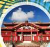
ปราสาทซูริ