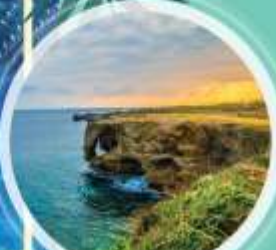
หน้าผามินซาโอะ