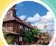
อมริกัน วิลลา