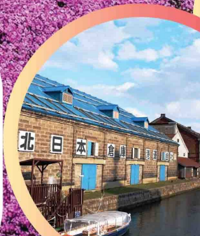
คลองโอตารุ