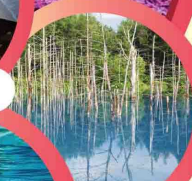
น้ำตกสึฟะ