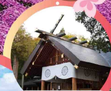
ศาลเจ้าฮอกไกโด

ชมทุ่งดอกฟิงค์มอส สวนทาคิโนะจู่เอะ สวนคามิยะเบ็ทสึ สวนสัตว์อาซาฮิยาม่า สวนโอโดริ หมู่บ้านราเมน เมืองโอตารุ ช้อปปิ้งจุกใจ ทานุกิโคจิ และ ชูชูกินะ เยือนหอนาฬิกา ศาลเจ้าฮอกไกโด