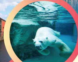
สวนสัตว์อาซาฮิยาม่า