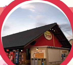
หมู่บ้านราเมนอาซาฮิคาวา