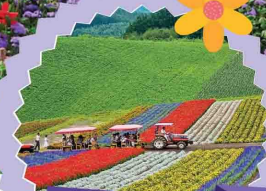
ซิคิโซโนะโอกะ