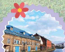
เมืองโอตารุ