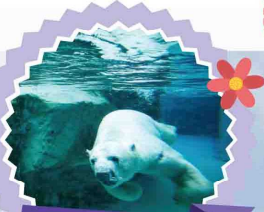
สวนสัตว์ อาซาฮิยาม่า