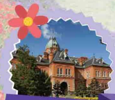
ตึกเก้ารูเบน