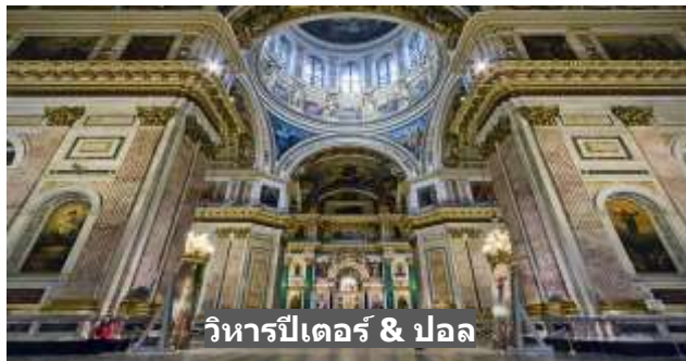
วิหารปีเตอร์ & ปอล