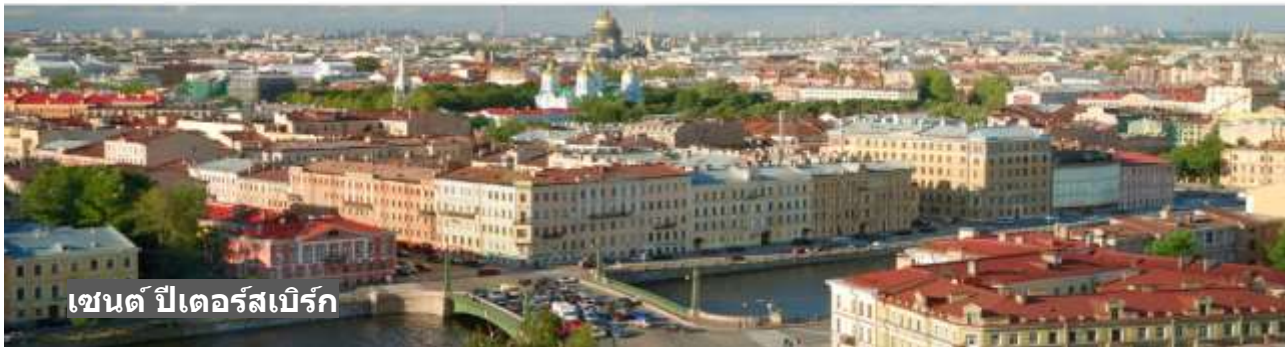
เซนต์ ปีเตอร์สเบิร์ก

นำท่านเที่ยวชมโดยรอบ นครเซนต์ปีเตอร์สเบิร์ก หรือชื่อเดิมว่า เลนินกราด ได้ชื่อว่าเป็นเมืองที่มีความสวยงามที่สุดแห่งหนึ่งของโลกจนได้ฉายาว่า "ราชินีแห่งยุโรปเหนือ" ผ่านชม วิหารเลือด ที่สร้างขึ้นเพื่อระลึกถึง พระเจ้าซาร์อเล็กซานเดอร์ที่ 3 ผ่านชม มหาวิหารคาซาน ที่สร้างขึ้นในสมัยพระเจ้าปีเตอร์มหาราช