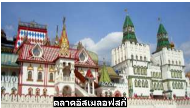
ตลาดอิสเมลอฟสกี

นำท่านช้อปปิ้งที่ ตลาดอิสเมลอฟสกี (Izmailovsky Souvenir Market) แหล่งจำหน่ายสินค้าที่ระลึก และสินค้าทั่วไป อาทิ เสื้อผ้า รองเท้า นาฬิกา งานไม้ งานแกะสลัก ตุ๊กตาแม่ลูกดก ร้านอาหารและร้านเครื่องดื่มมากมาย เป็นย่านช้อปปิ้งยอดนิยมของนักท่องเที่ยวไทย