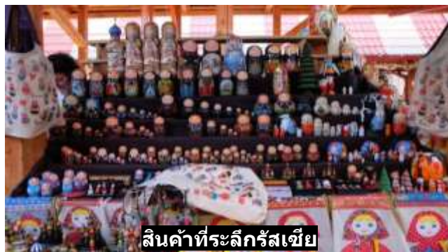
สินค้าที่ระลึกรัสเซีย

17.30 น. บริการอาหารค่ำ ณ กภัตตาคารอาหารจีน Golden Dragon Restaurant