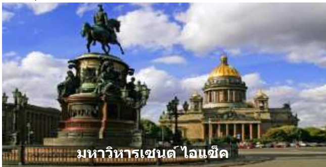
มหาวิหารเซนต์ ไอแซค

จากนั้นนำท่านเข้าชม วิหารปีเตอร์ & ปอล สร้างขึ้นระหว่างปีค.ศ 1712-1733 และตั้งชื่อนี้เพื่อเป็นเกียรติแด่ผู้เผยแพรศาสนา นักบุญปีเตอร์ และนักบุญปอล ความสำคัญของวิหารแห่งนี้คือเป็นที่เก็บศพของกษัตริย์ราชวงศ์โรมานอฟทุกพระองค์ โดยเริ่มต้นจาก พระเจ้าปีเตอร์มหาราช เป็นพระองค์แรกจนกระทั่งถึงกษัตริย์องค์สุดท้ายคือ พระเจ้านิโคลัสที่ 2