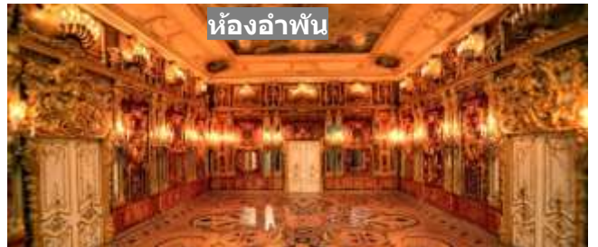
ห้องอำพัน

17.00 น. นำท่านเดินทางสู่ Zenit Arena สนามแข่งขันฟุตบอลโลก 2018 รอบรองชนะเลิศ มีความจุ 68,000 ที่นั่ง เป็นสนามที่สร้างขึ้นใหม่เพื่อการแข่งขันฟุตบอลโลก 2018 ด้วยงบประมาณการสร้างที่สูงถึง 1 พันล้านเหรียญสหรัฐ ตั้งอยู่บนเกาะ Krestovsky Island ในอ่าว Neva ห่างจากเมืองเซนต์ปีเตอส์เบิร์กประมาณ 7 กิโลเมตร หมายเหตุ : - ควรเดินทางถึงสนามก่อนการแข่งขัน 3 ชั่วโมง