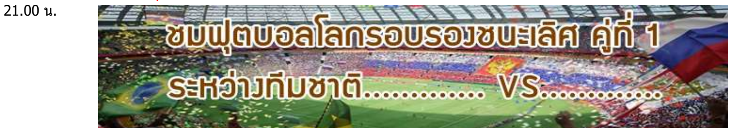
ชมฟุตบอลโลกรอบรองชนะเลิศ คู่ที่ 1 ระหว่างทีมชาติ..... VS.....

17.00 น. นำท่านเดินทางสู่ Zenit Arena สนามแข่งขันฟุตบอลโลก 2018 รอบรองชนะเลิศ มีความจุ 68,000 ที่นั่ง เป็นสนามที่สร้างขึ้นใหม่เพื่อการแข่งขันฟุตบอลโลก 2018 ด้วยงบประมาณการสร้างที่สูงถึง 1 พันล้านเหรียญสหรัฐ ตั้งอยู่บนเกาะ Krestovsky Island ในอ่าว Neva ห่างจากเมืองเซนต์ปีเตอส์เบิร์กประมาณ 7 กิโลเมตร หมายเหตุ : - ควรเดินทางถึงสนามก่อนการแข่งขัน 3 ชั่วโมง