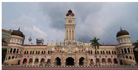
100 เมตร โดยบริเวณรอบๆนี้ ยังเป็น

(เวลาท้องถิ่นประเทศมาเลเซียเร็วกว่าประเทศไทย 1ชม.) นำท่านผ่านพิธีการประทับตราหนังสือเดินทาง จากนั้นนำท่านเดินทางสู่ กรุงกัวลาลัมเปอร์ เมืองหลวงประเทศมาเลเซีย ชม จัตุรัสเมอร์เดกา(ลานแห่งอิสระภาพ) ลานประกาศเอกราช Independence Square หลังจากที่ยังคงเคยปกครองมาเลเซียมาอย่างยาวนาน เป็นลานหญ้าสีเขียวขนาดใหญ่ หากจะเทียบกับของประเทศไทย จะคล้ายกับสนามหลวงบ้านเรา และชมอดีตเสาธงที่สูงที่สุดในโลก Union Jack ที่สูงถึง 100 เมตร โดยบริเวณรอบๆนี้ ยังเป็นสถาปัตยกรรมอังกฤษอย่างเห็นชัด ไม่ว่าจะเป็นตึก อาคาร หอนาฬิกา ที่ทุกๆ วันชาติของ มาเลเซีย ชาวมาเลเซียจะมาชุมนุมเพื่อเฉลิมฉลองและมิ่งงานรื่นเริงกัน ซึ่งธงชาติ อังกฤษได้ถูกลดลงครั้งสุดท้ายเมื่อวันที่ 31 สิงหาคม 1957 และแทนที่ด้วยธงชาติมาเลเซีย