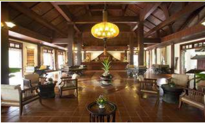
บรรยากาศในล็อบบี้ของ Santi Resort & Spa

สินค้าพื้นเมือง ที่ทอดด้วยวายเป็นถนนคนเดินตลอดแนวถนนข้าวเหนียว ( ถนน สักกรินทร์ )