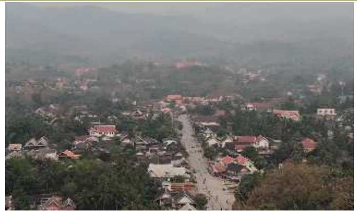
บรรยากาศภายในตัวเมืองหลวงพระบาง