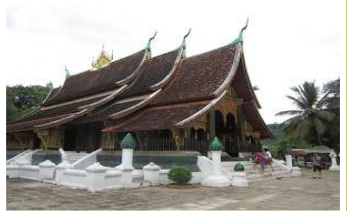
วัดเชียงทอง