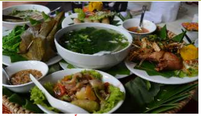
อาหารต้อนรับมือกลางวันของ Santi Resort & Spa