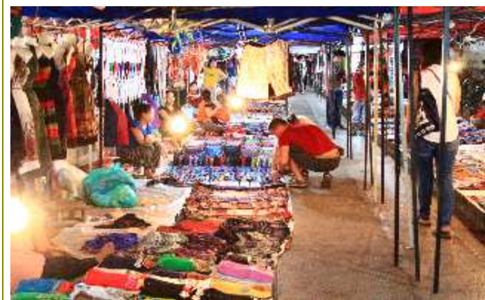
บรรยากาศตลาดกลางคืน