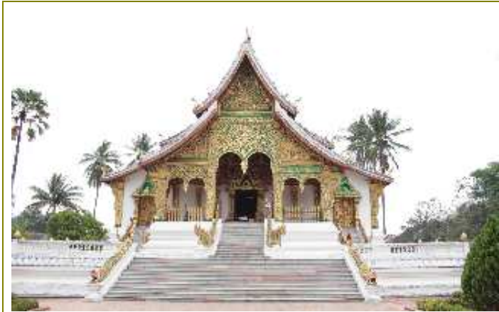
พระราชวัง และ หอพิพิธภัณฑสถานหลวงพระบาง

หมู่บ้านคู่มือเมืองหลวงพระบางและของชาวลาว ซึ่งเป็นที่มาของชื่อเมืองหลวงพระบาง วัดแสนสุขารมย์ วัดที่มีชื่ออันเป็นมงคล และเป็นวัดคู่มือเก่าแก่ที่สุดอีกหนึ่งวัด สร้างในปี คริสต์ศตวรรษที่ 15 ที่ซ่อนความธรรมดาที่ไม่ธรรมดา ของจิตรกรรมภาพวาด ในยุคโยนก ที่มีลักษณะ เหมือนจิตรกรรมภาพวาด ของสกุลช่างเมืองน่าน ซึ่งจะพบเห็นได้ ในวัดหลายแห่งของจังหวัดน่าน ที่ถูกจัดให้เป็นเมืองคู่มือ และ รวมถึง จังหวัด เลย (ประตูทางเดินของวัดแห่งนี้สามารถเดิน เชื่อมต่อ เดินไปยังอีกสามวัด ติดกันได้ และ ยัง เป็นอีกหนึ่งสถานที่ยอดนิยม ที่มีอาคารรูปทาง ซิโนโปรตุเกส เรียงราย ตลอดแนวสองฝั่งถนน ที่สวยงาม และ เงียบ สงบ ) วัดเชียงทอง วัดสวยงามที่สุด ที่เป็นที่เก็บพระ ราชรถเกย เมื่อครั้ง สมเด็จพระเจ้ามหาชีวิต และ ยังเป็นสถานที่สำคัญ ที่คู่แต่งงาน ชาวลาว นิยมต้องมากราบไหว้ พร้อมทั้งถ่ายรูปคู่ ณ วัดแห่งนี้ และ ที่พลาดไม่ได้ ต้อง ชมพระม่าน ในโบสถ์เล็ก (จะมีช่องเล็ก ๆ ให้ทุกคนหรีด่าข้างหนึ่งมองเข้าไป จึงจะเห็น) พระม่าน หนึ่งปีจะอันเชิญ แห่รอบเมืองหลวงพระบาง ในเทศกาลสงกรานต์ปีใหม่ลาว เพื่อให้ประชาชนสักการบูชา อย่างใกล้ชิด หากยังไม่จุใจ ไปอ้อมพระเสด็จทวย อยู่ใกล้ ๆ หอพระม่าน ก็ลองอธิฐานเสด็จทวยกันดู คงใครดวงมัน หลายท่านพิสูจน์แล้ว ว่าแม่นจริงๆ ไม่เชื่อลองตั้งอธิษฐาน พิสูจน์ได้ด้วยตัวเอง