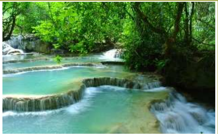
น้ำตกกวางสี