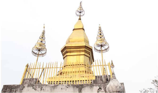
พระธาตุพุฒิ